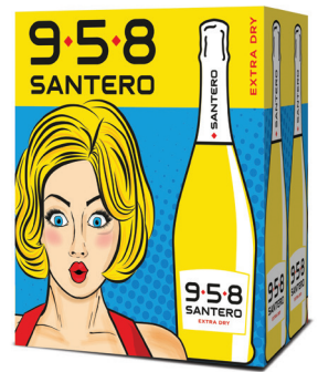
Cartone 6 bottiglie 750 ml