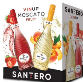
Cartone 6 bottiglie 750 ml